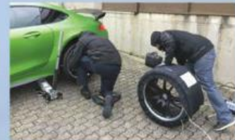
Kühlschrank Nordschleife Wegen der Kälte (4 Grad Celsius) wurden die Cupreifen vorgeheizt